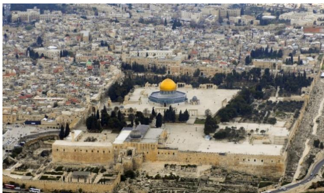
Temple_Mount-Aerial view 2007 from south. 2007 : Vue aérienne du Mont du Temple coté sud.

Comment les monothéismes se sont-ils installés et développés dans cette ville-miroir de l'histoire des mondes qu'est Jérusalem ?