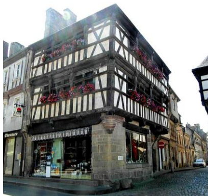
Maison du Sénéchal et Pierre des Bannies