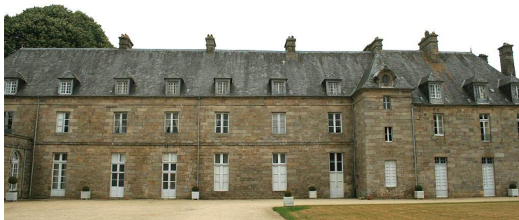
Château de Quintin