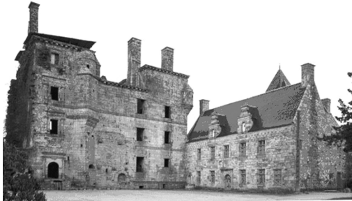
2 - Château de Kerroué avant sa restauration.

Le château de Kerroué a été acquis en 1990 par la famille Le Lièvre de La Morinière qui, depuis 1993, a entrepris une splendide et spectaculaire rénovation de l'ensemble, rendant ainsi à ce château tout son lustre d'antan.