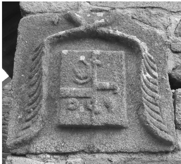
1 - Pierre armoriée du colombier replacée à l'envers dans le mur d'une ancienne dépendance du château. (telle qu'elle se trouve actuellement dans le mur)

Elle porte les armes mi-parties des du DRESNAY : d'argent à la croix ancrée de sable, accompagnée de trois coquilles de gueules et des LE LAY : d'argent à la fasce d'azur, accompagnée en chef de trois annelets de gueules, et en pointe d'une aigle éployée de sable, becquée et membrée de gueules.