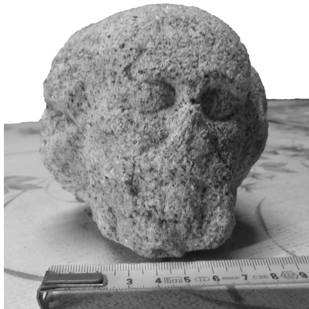
4 – Tête en pierre trouvée à Keroué