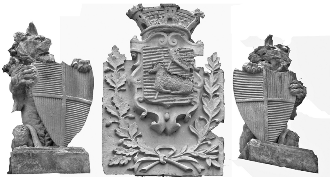
2 - Armoiries de Lannion au fronton de la Mairie avec les écus en écartelé. Ces pierres proviendraient de l'ancien auditoire

Pour le moment nous n'avons pu déterminer l'origine de cet écartelé. La recherche doit être poursuivie dans l'espoir de pouvoir découvrir l'appartenance de ces armes.