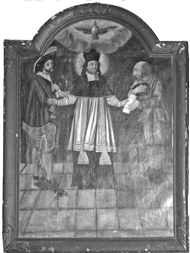
4 - Brélévénéz : (nef) : St Yves entre le riche et le pauvre (de Louis Guérin - 1739)