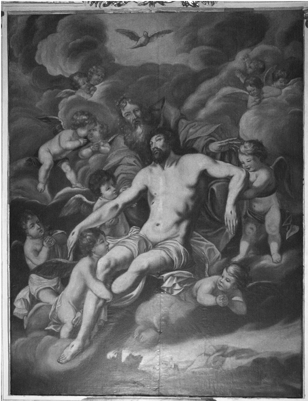
3 - Brélévénéz : Maître-autel