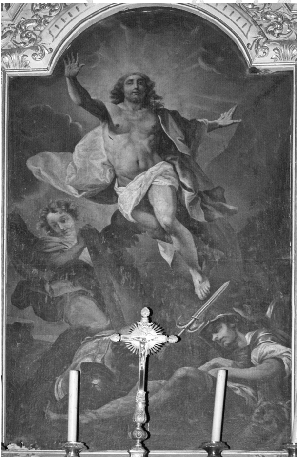
5 - Brélévénéz : Chapelle nord