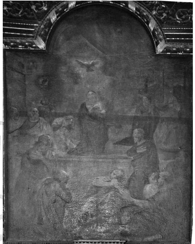
4 - Brélévénéz : Chapelle sud ; La Trinité (fin du VII ème )