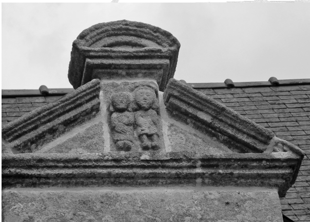
9 - Manoir de Kergoz (détail)

Après le déjeuner, nous nous dirigeâmes vers le manoir et la chapelle de Guernaham. Le manoir, bâti en équerre, s'orne d'une tour polygonale du XV e siècle.