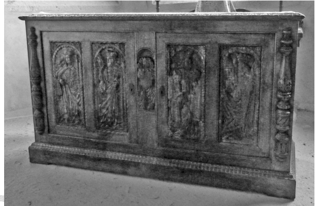
6- Autel de la chapelle de La Trinité

Un autre sentier nous mena vers un petit oratoire de pierre appelé « an Umaj » surmonté lui aussi d'une croix.