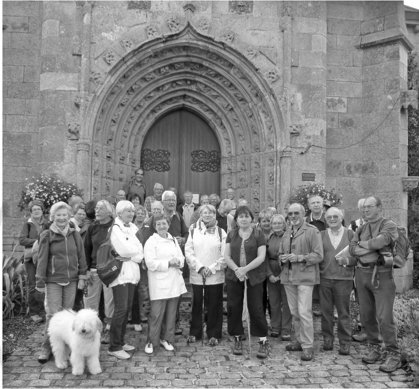
1 - Le groupe au départ devant l'ancien portail de l'église

Le dimanche 4 septembre, par une belle journée, cinquante-huit personnes empruntèrent les chemins creux du Vieux-Marché pour découvrir le riche patrimoine de cette commune.