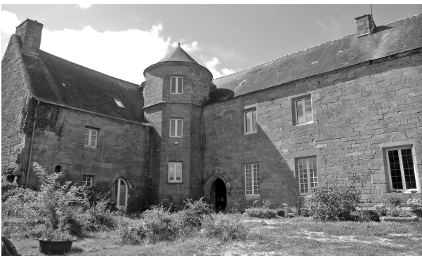
10 - Manoir de Guernaham

Après le déjeuner, nous nous dirigeâmes vers le manoir et la chapelle de Guernaham. Le manoir, bâti en équerre, s'orne d'une tour polygonale du XV e siècle.