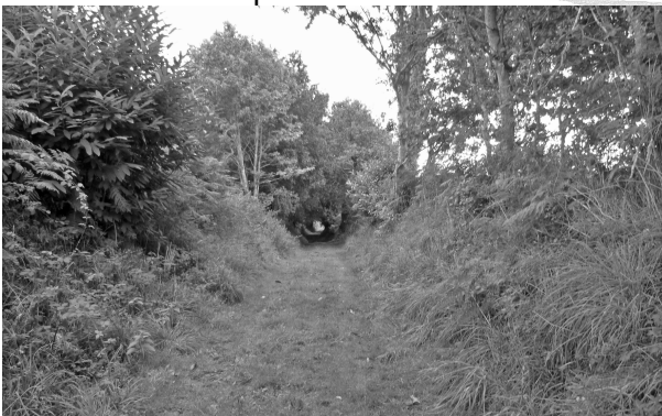
2 - Chemin creux

Le dimanche 4 septembre, par une belle journée, cinquante-huit personnes empruntèrent les chemins creux du Vieux-Marché pour découvrir le riche patrimoine de cette commune.