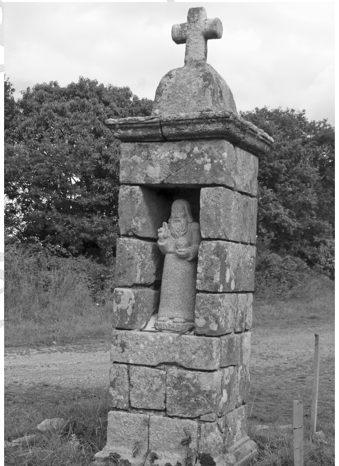
7 - Oratoire an Umaj

Un autre sentier nous mena vers un petit oratoire de pierre appelé « an Umaj » surmonté lui aussi d'une croix.