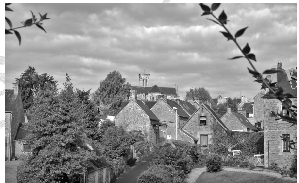
12 - Vue sur le Bourg, au retour de la balade.

Crédits photos : Liliane Le Gac et dessin de Christian Kulig avec son autorisation