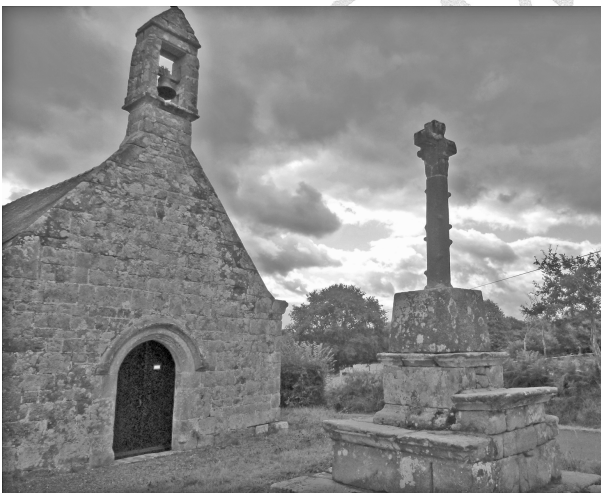
4 - Chapelle de La Trinité

Datant de la fin du XV ème siècle, elle dépendait de la seigneurie de Guernaham qui relevait des seigneuries de Grand Bois et du Vieux-Marché. Cette chapelle possède un très beau chevet en demi-hexagone. A l'intérieur, le meuble servant d'autel comporte quatre panneaux sculptés du XV ème siècle. Sur le placître, on peut admirer un calvaire avec Piéta.