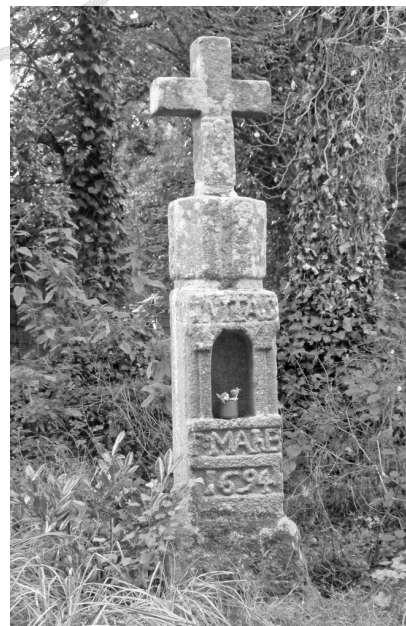
3 - Kef an Drinded

Le premier chemin nous conduisit au « kef an Drinded ». Ce petit monument de pierre, niché dans la verdure, est couronné d'une croix, symbole du Christ. Il date de 1694.