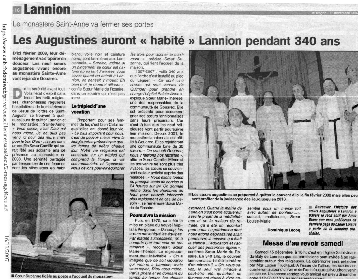
Figure 2 : Départ des Augustines de Lannion - Le Trégor 13.12.2007

Après la vente de leur monastère à la Ville de Lannion en janvier 2003, les dernières Augustines quitteront définitivement Lannion en 2008, pour rejoindre leur communauté de Gouarec.