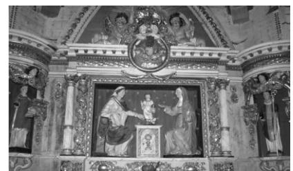
Retable de la chapelle Ste-Anne

Au XVII e , un retable aux boiseries dorées est ajouté à la chapelle, mettant en scène l'environnement familial et humain de Jésus