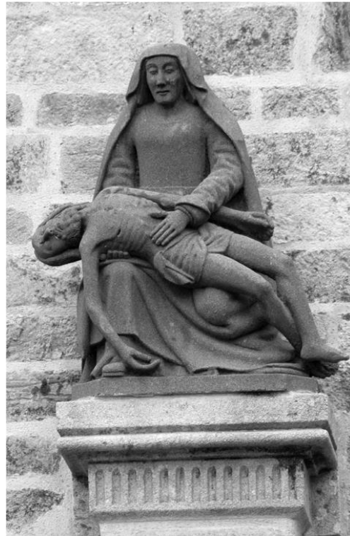
Pietà (Porche des Apôtres)