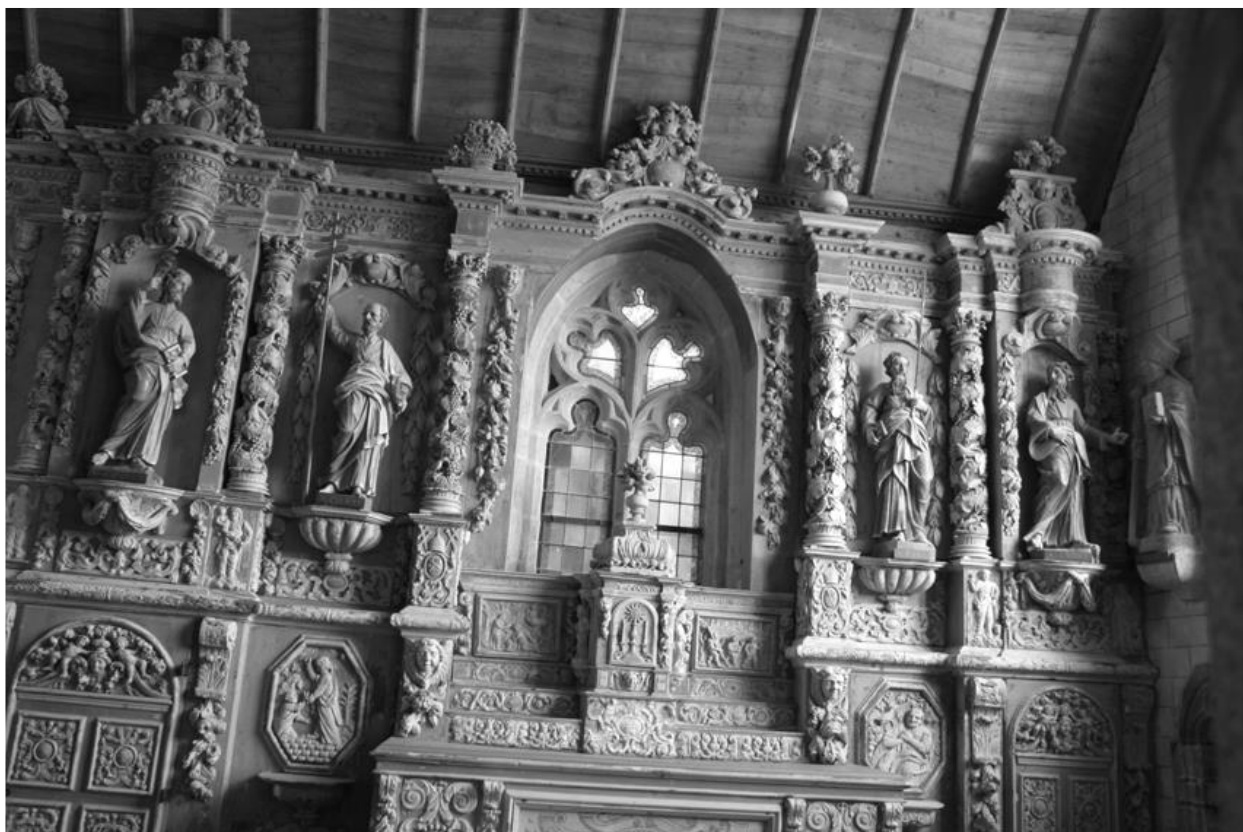
Retable de l'autel sud