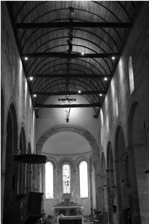
Eglise abbatiale de Daoulas

Construit en 1566, mélange de gothique et de Renaissance, il en fait déplacé en 1880 et restauré en 2007. Sous l'arche sont présents le Christ et ses douze Apôtres.