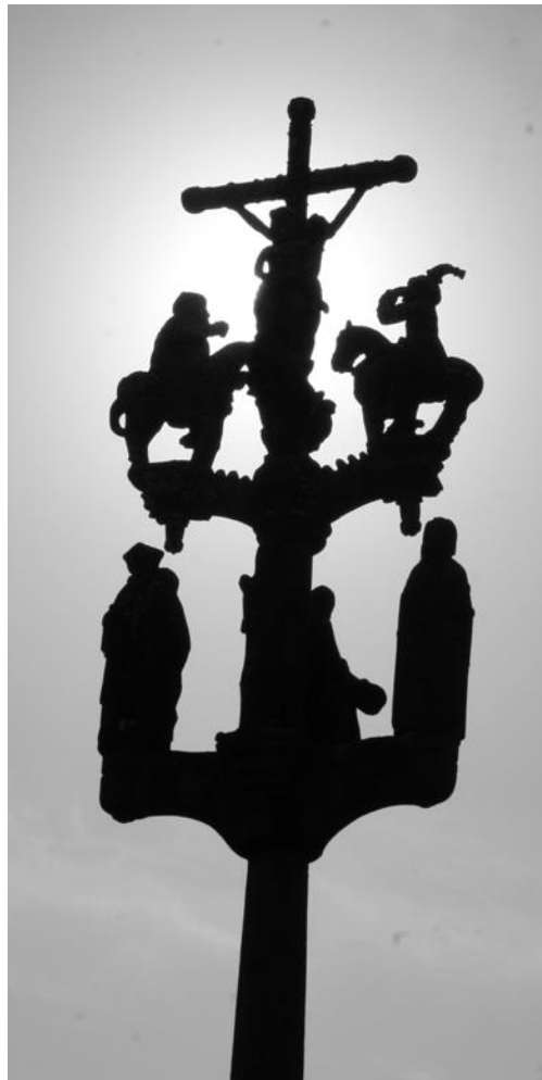
Calvaire de Sainte-Marie du Menez-Hom

Mais quel récit légendaire le sculpteur a-t-il voulu évoquer dans une scène de labour où les chevaux s'emballent ? Au-dessus de trois emmarchements, s'élèvent la croix du Christ et celles des deux larrons. Ce calvaire st de 1544 et porte une belle inscription : « JEHAN LE ALODER FABRICQUE FEIST CESTE CROIX L MVccXLIIII ».