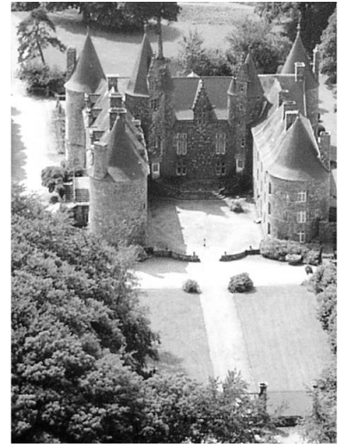
Le château de Kergrist

(D'après Flohic :) Vers 1500, le château de Runfao tombe en tombe en ruines. Le château de Kergrist est construit vers 1537 pour le remplacer. C'est un vaste logis dont la façade nord, côté cours intérieure, conserve le style gothique flamboyant, avec des tours imposantes, qui en font un édifice bien plus imposant qu'un simple manoir. Ceci s'explique aisément au vu de l'ancienneté et de la puissance qui caractérisent les seigneurs de Kergrist. Louis de Kergrist est le propriétaire des lieux en 1540. Au XVII e siècle, la façade est entièrement refaite en style Renaissance, de même que la façade sud au siècle suivant. Le château est acheté en 1860 par les Huon de Pénanster.