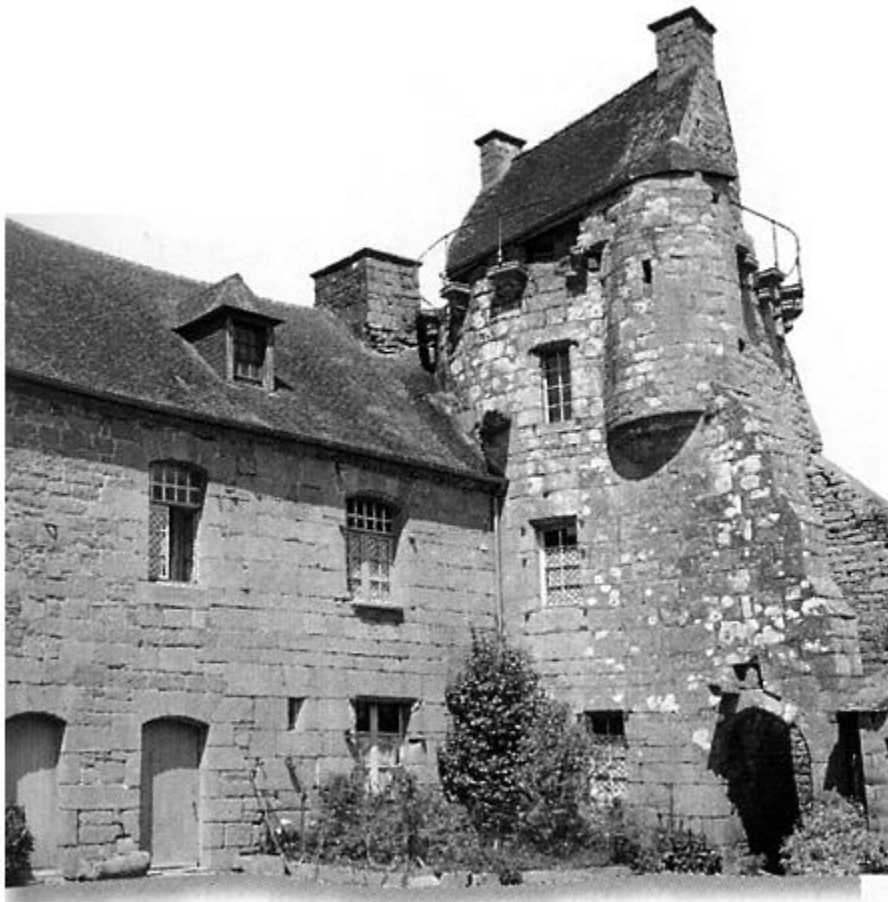
Manoir de Kerhervé

(D'après Flohic :) .Ce manoir succède à une motte féodale qui subsiste au bord de la rivière proche. Le corps principal semble dater du XVII e siècle. Au XV e siècle, Jean de Kaervé est mentionné seigneur des lieux et de Kériarnouen . Cette seigneurie s'impose comme l'une des plus importantes de Ploubezre.